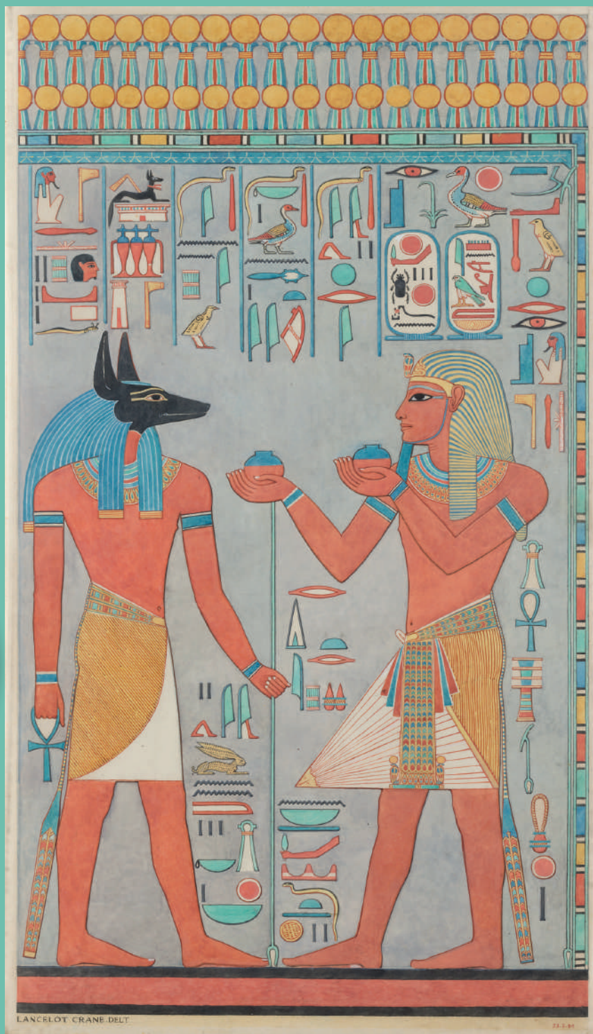
O Rei com Anúbis, Tumba de Horembebe, Lancelot Crane (1910-11; original de 1323-1295 a. C.)