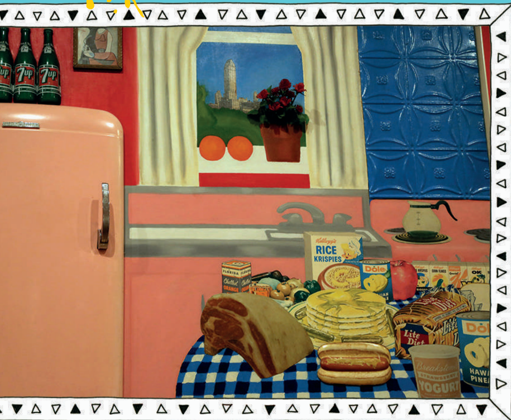
Natureza-Morta #30, Tom Wesselmann (1963)

O frigorífico, as garrafas, as flores, o quadro pendurado, a parede azul com relevo e os alimentos sobre a mesa são colagens. Tudo o resto que vês, foi pintado por Wesselmann. Ele adorava as formas dos objetos do quotidiano e as cores brilhantes.