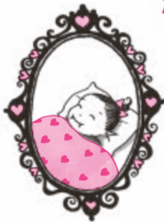
★ Bebé Flor-de-Mel