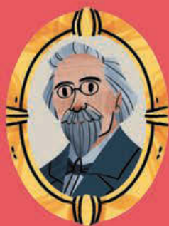
Ilustração: Sara Paz