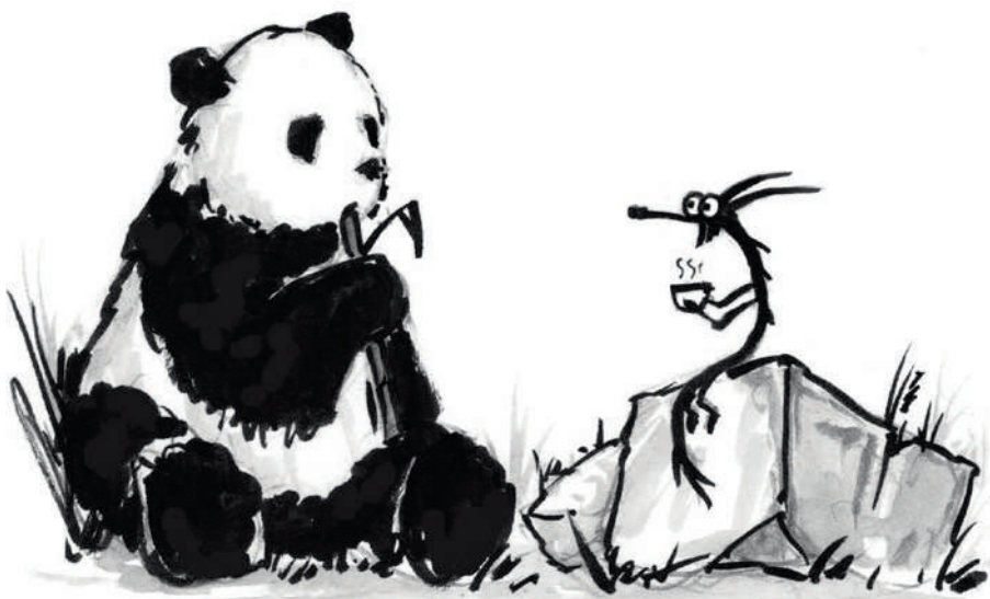
O Grande Panda e o Pequeno Dragão.