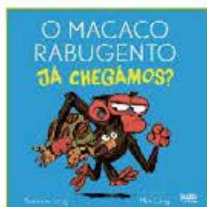
O MACACO RABUGENTO: JÁ CHEGAMOS? Suzanne Lang NUVEM DE LETRAS