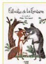
FÁBULAS DE LA FONTAINE Jean de la Fontaine NUVEM DE LETRAS