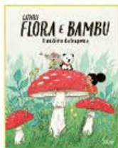
FLORA E BAMBU 3: O MISTÉRIO DA TOUPEIRA Cathon LILLIPUT