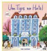
UM TIGRE NO HOTEL Sam Sharland NUVEM DE LETRAS